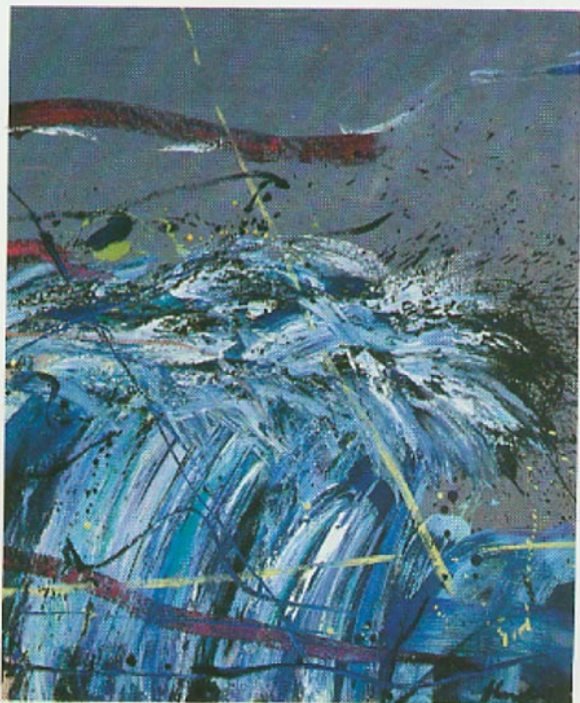
Kameni val, 1991, ulje na platnu, 110 x 100 cm

□ Za mene je umjetnost uvijek optimistična, jer kad je i najcrnija, afirmira čovjeka. U podjeli na apolonsko i dionizijsko, spadam u potonju skupinu. Po toj hedonističko - optimističkoj karakteristici pripadam matičnoj struji koja njeguje klasičnu modernu i estetski pristup. Moderna poezija stara je sto godina, kako je jednom netko napisao. Tako je i moje slikarstvo staro više od pedeset godina. Klasično u smislu da se kod današnjih mladih umjetnika umjetnost svela na gramatiku, racionalni likovni jezik. Postavljeni zadatak rješavaju unutar racionalnog jezika. Znanost postavlja zadatke i probleme koje je moguće riješiti. Umjetnički eksperiment je druge vrste. On postavlja nerješiva pitanja. Istraživanje se vrši u sebi. Kao da se bojimo u ovom vremenu tehnologije i napretka pouzdati u srce. U njegovu nepogrešivu intuiciju. Sličan je problem i u poeziji. Ona iz poznatog jezika mora izraziti nepoznata stanja. S racionalnim postiže iracionalno. Iz tvorničke tube, iz industrijskog proizvoda, a i jezik možeš smatrati industrijskim