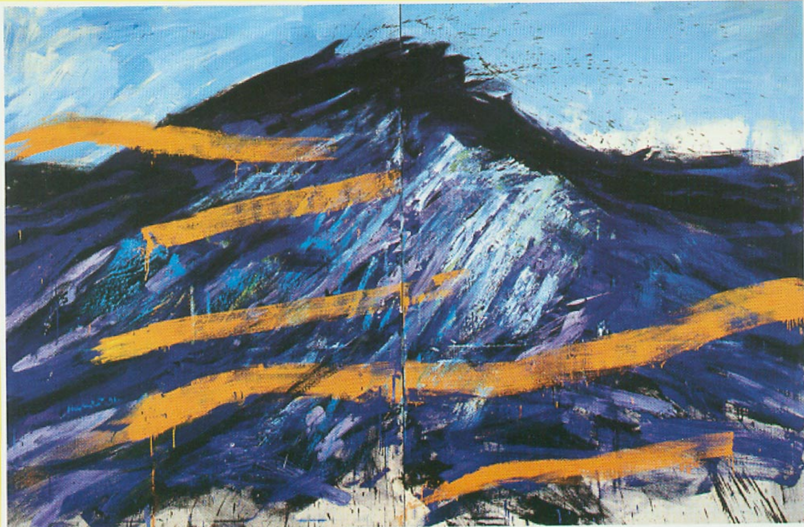
3000 m mora, 1991, ulje na platnu, 200 x 300 cm, vlasništvo Moderne galerije Zagreb

produktom, moraš proizvesti novu poetiku. Volim čitati pjesme, iz njih crpim metafizičku snagu.